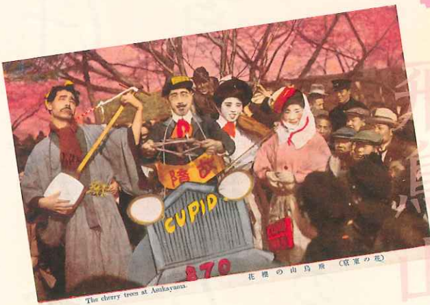
The cherry trees at Amakayama