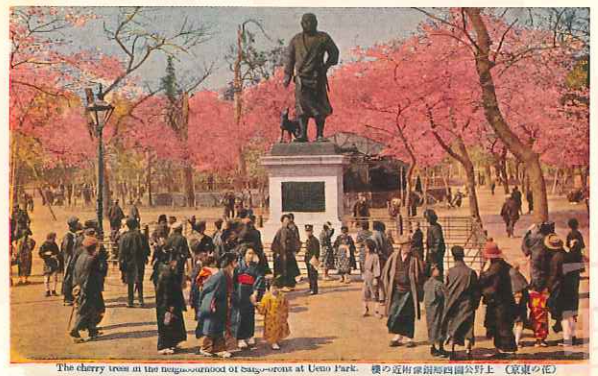
The cherry trees at the neighbourhood of Sagayama at Ueno Park. 櫻の近衛源朝馬場公園野上 (東京の花)